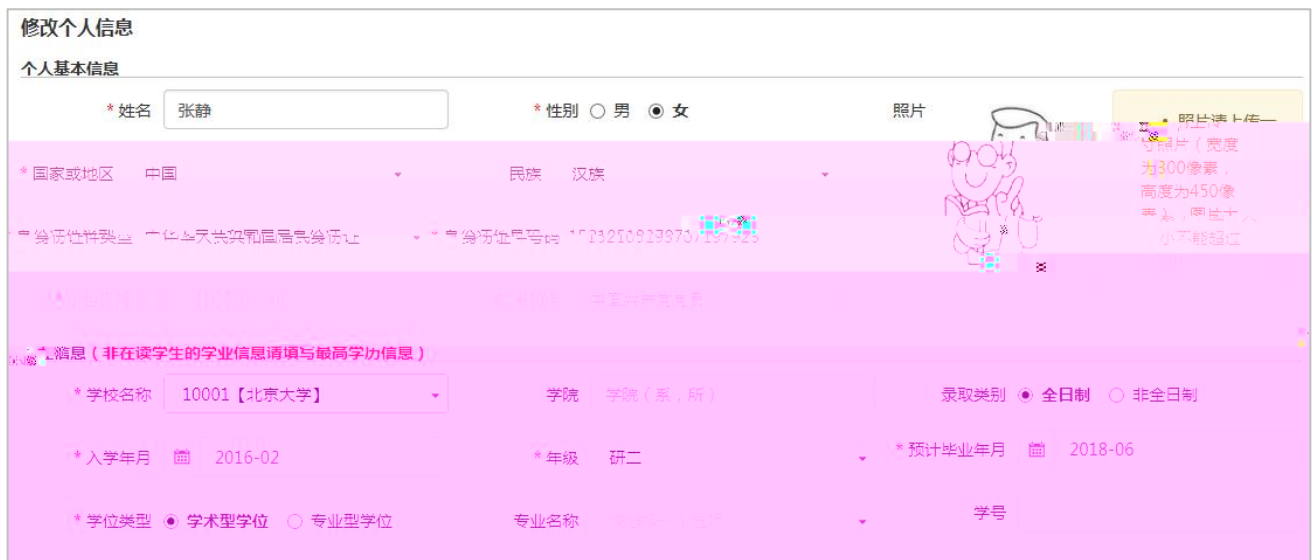
图 修 个人 信息